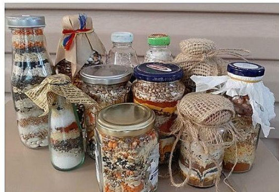
Sporul casei, clasa a V-a A, Școala Gimnazială Nr. 1 Eforie Nord