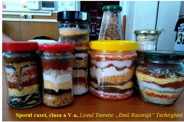
Sporul casei, clasa a V-a, Liceul Teoretic „Emil Racoviță” Techirghiol