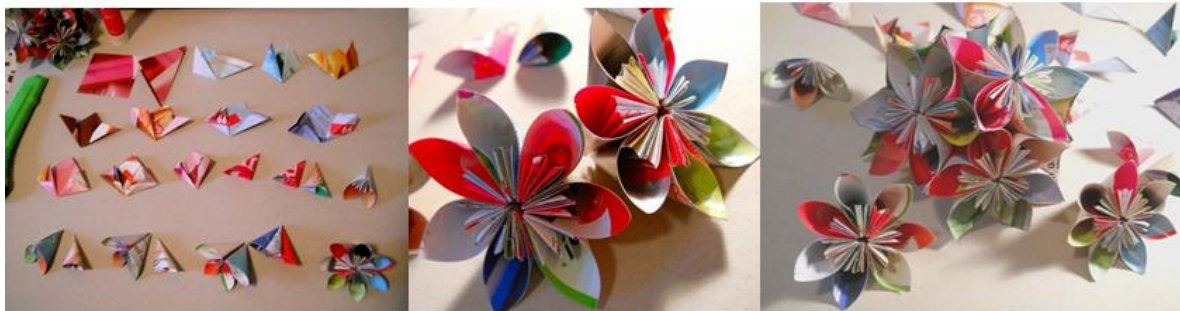
Descoperă frumusețea florilor din hârtie reciclată - Tehnica Origami